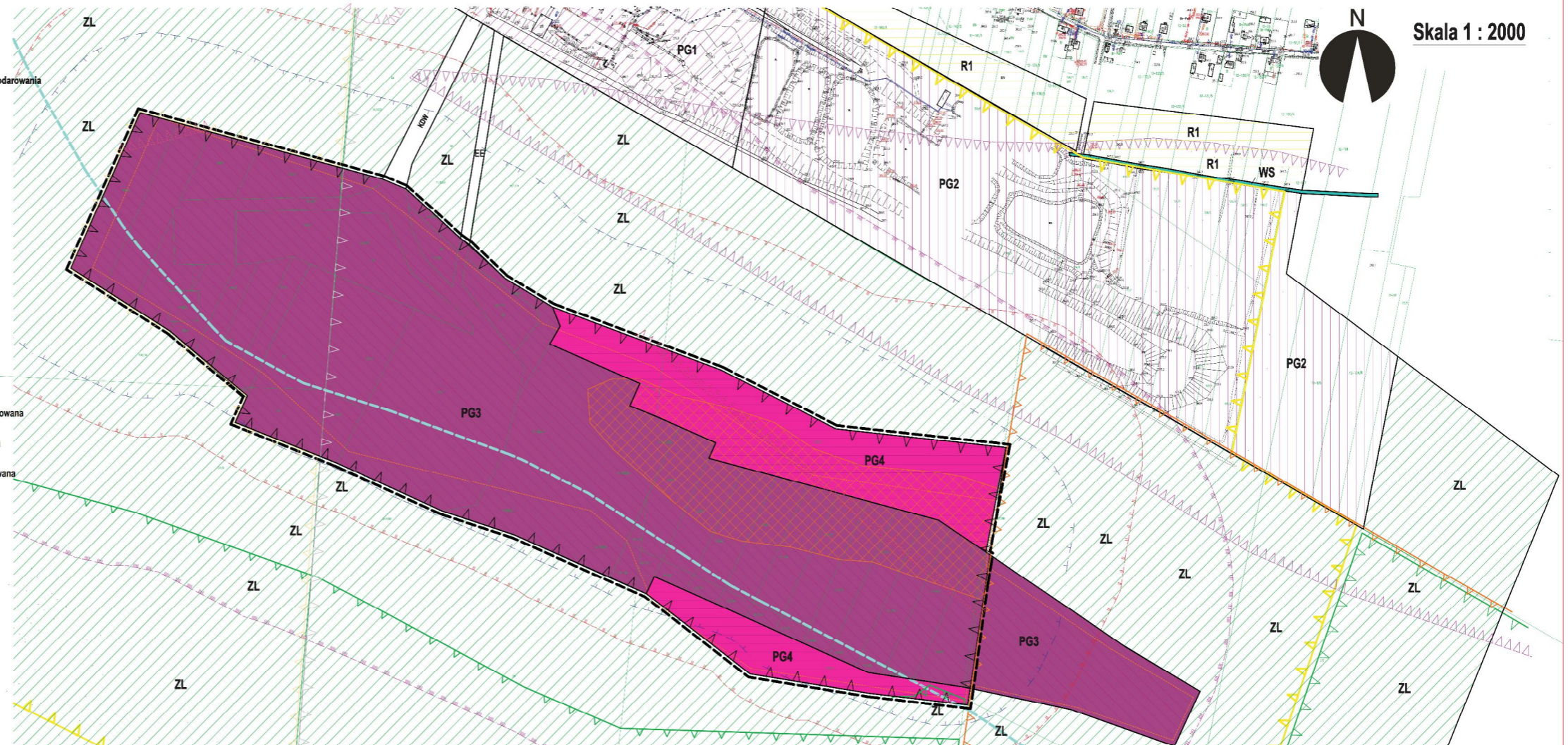
WYRYS Z RYSUNKU ZMIANY STUDIUM UWARUNKOWAŃ I KIERUNKÓW ZAGOSPODAROWANIA PRZESTRZENNEGO GMINY ŁĄCZNA uchwalonego Uchwałą nr XXI/101/2016 Rady Gminy Łączna z dnia 18 lipca 2016 r.